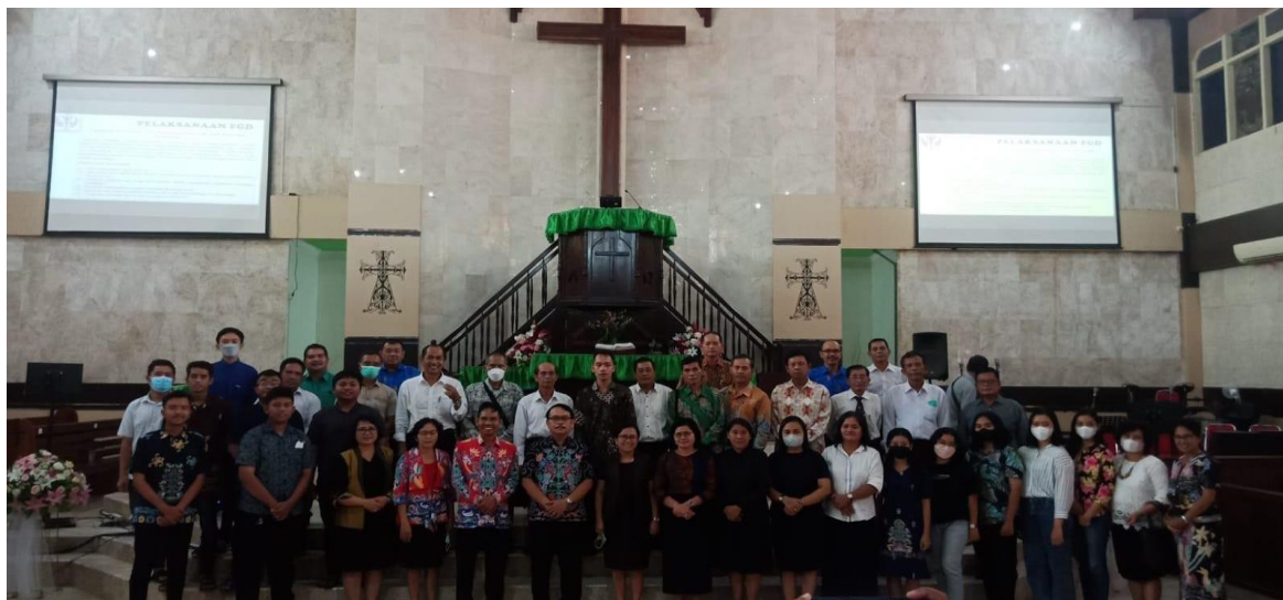
Gambar 3: Tim bersama para peserta FGD

Kegiatan FGD di Jemaat GKE Kapuas dipusatkan di Gereja Sinta, dan dihadiri oleh unsur-unsur kategorial yakni anggota Seksi Pelayanan Bapak, Seksi Pelayanan Perempuan, Seksi Pelayanan Remaja dan pemuda dan pengurus Seksi Pelayanan Anak. Jumlah peserta dalam kegiatan FGD tersebut adalah 52 orang.