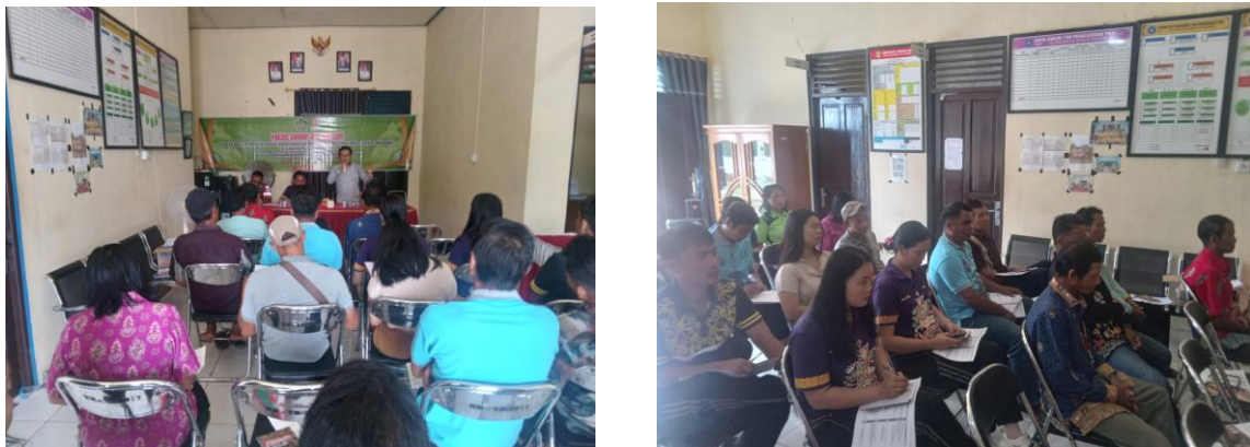
Gambar 2. Kegiatan Diskusi dan FGD

Kegiatan edukasi melalui sosialisasi diawali dengan paparan sosialisasi keberadaan program food estate singkong yang hadir di desa mereka sebagai program pemerintah pusat. Tata kelola pemerintahan tingkat desa penting untuk diidentifikasi mengingat regulasi UU Desa memberi ruang bagi pemerintah desa melaksanakan pemerintahan otonom, terlepas dari hierarki pemerintah kabupaten. Desa juga memperoleh transfer dana desa dan alokasi dana desa yang tiap-tiap desa bervariasi jumlahnya. Dana transfer tersebut sebagai wujud komitmen pemerintah untuk membuat tata kelola desa menjadi lebih baik dan menjadikan desa sebagai entitas pemerintahan yang mandiri.